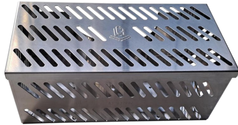
Pare-gravier de protection avec couvercle clipsé